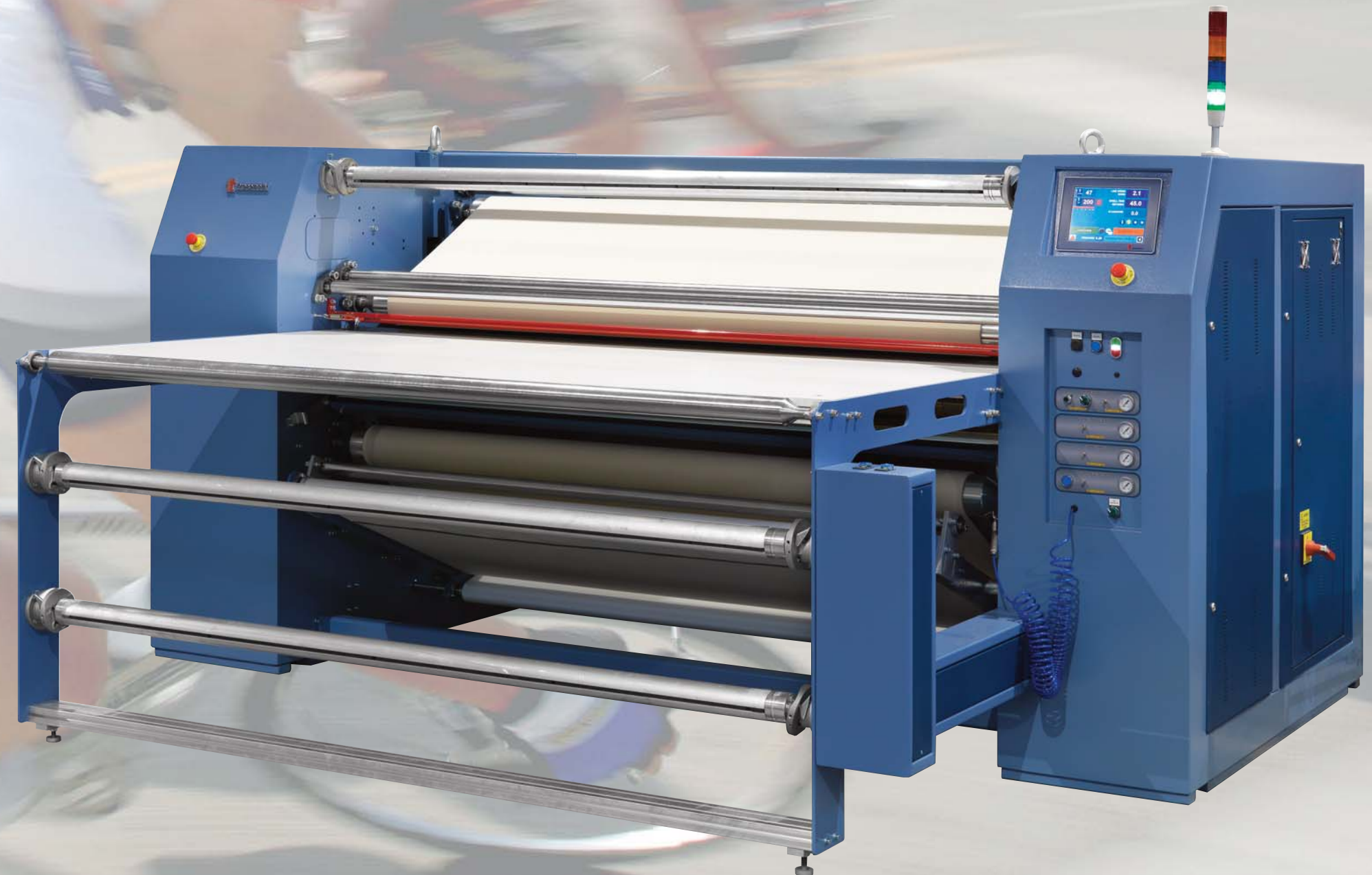
Heat Seal Machines